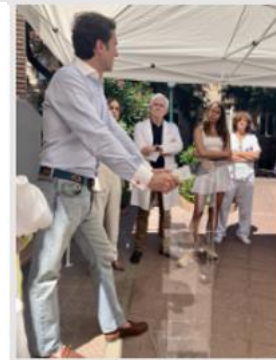
Juan Garaizabal Hospital Cruz Roja Madrid Julio 2024

Mi lenguaje: las memorias urbanas para recuperar espacios históricos por el mundo