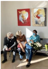
Alberto Palomera Hospital Cruces Bilbao Enero 2024

Ante una obra de arte primero la emoción, después la comprensión