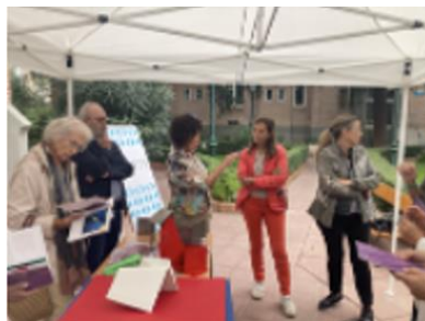
Aurora Cid Hospital Cruz Roja Madrid Octubre 2024

Un placer compartir mi trabajo en el hospital