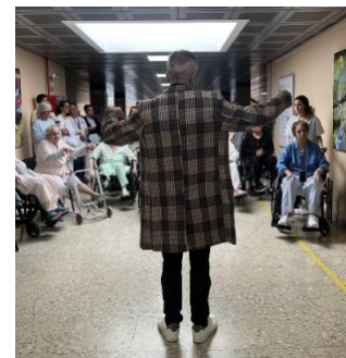
Baldo Limón Hospital Virgen de la Poveda Noviembre 2024

Un placer compartir mi trabajo en el hospital